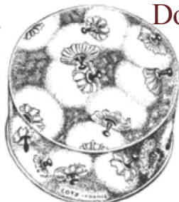
NOVI OBLIK narevna veličina

...Cast nam je oblik... ...iterije, da smo izvanjski oblik polu- ...kutije pudera (Broj serije 019) izmijenili. ...Mi smo dosada lijevovoli taj artikal ...u kutiji koja je bila... ...liji je ukras bio potpuno isti kao i ...natoj velikoj kutiji pudera (Broj se- ...rije 060). ...Sada smo međutim uveli kutiju koja ...je niža i šira, te sadrži više pudera i ...praktičnija je od prijašnje. ...Ova modifikacija je daleko vrlo po- ...godna za naše cij, mušterije. ...Ukras nove kutije se razlikuje od ...stare samo u podložnoj boji, koja je ...sada svijetlo smeđa sa zlatom, i tako ...daje čistavoj kutiji zagašiji ton. ...Sam puder je isti kao do sada — a ...to je onaj, koga po čistavom svijetu — ...milijoni elegantnih dama vole radi sa- ...vrienog njegovog sastava, finoće i odlič- ...nog mirisa.